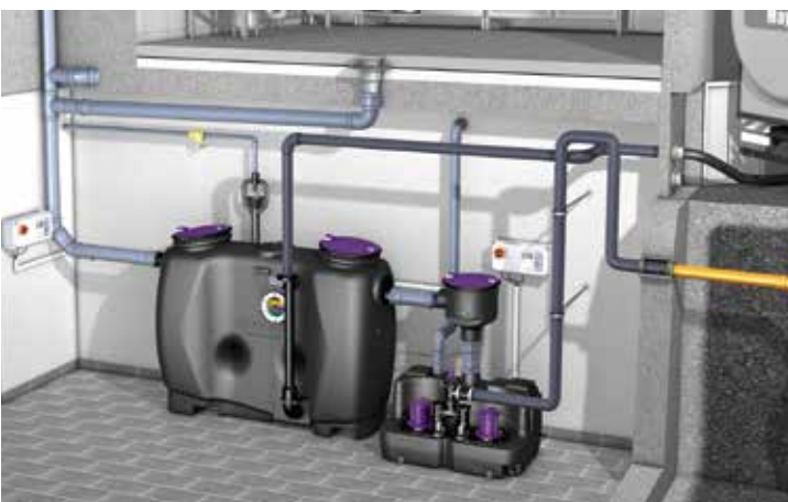
EasyClean free para instalação em piso inferior à cozinha