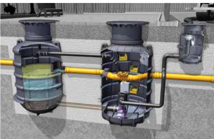
EasyClean ground para instalações soterradas

A KESSEL combina a facilidade de instalação, performance de limpeza e eficiência energética nos seus separadores de gorduras EasyClean free . A forma estreita do tanque oferece duas vantagens: 1) toda a decantação e separação ocorre dentro do tanque em toda a sua extensão. 2) fácil de transportar e manusear e a possibilidade de colocá-lo diretamente contra a parede, economizando espaço.