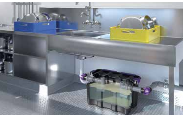
EasyClean free UnderSink para cozinhas

A solução versátil para instalação apoiada ou soterrada