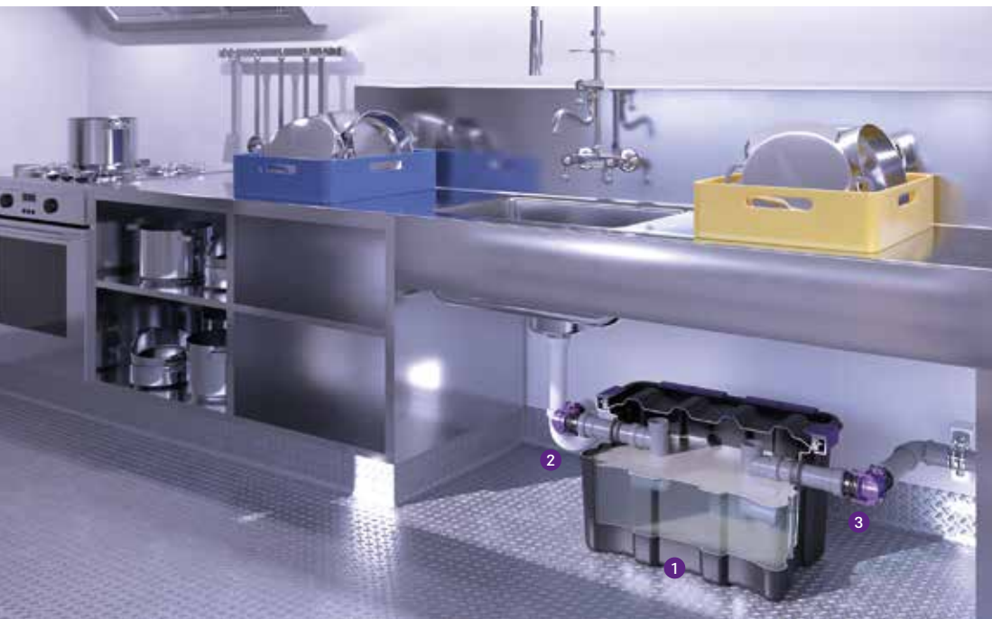
1 Separador de gorduras

Nas roulettes de rua, nos restaurantes ou take-away, nos centros comerciais ou em pequenos cafés ou bares: A instalação de separadores de gordura de grandes capacidades nem sempre é possível. Se for este o seu caso, e se não tem caudais muito elevados, então é um caso para a aplicação do Separador EasyClean free UnderSink – otimizado para instalação apoiada sob a bancada onde o espaço não abunda. O seu baixo peso e formato compacto permitem um fácil manuseamento. Graças ao seu sistema de encaixe com rotação 360°, o tanque é facilmente removido do seu local para limpeza e manutenção. O separador de gorduras EasyClean free UnderSink foi testado em banco de ensaio com um caudal de 0,7l/s o que o torna adequado para aplicar diretamente acoplado a um pio de lavagem – eficiência a um preço acessível para um equipamento com certificação TUV.