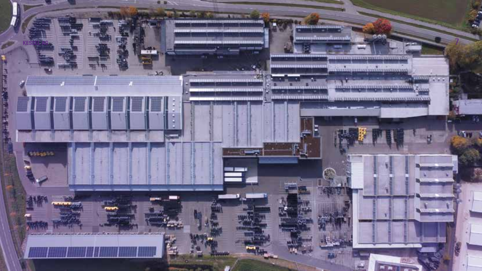
KESSEL Sede em Lenting, Alemanha